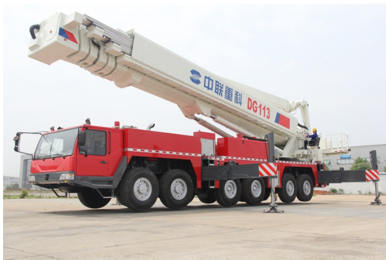
2013 年 5 月，中联重科推出全球最高 113 米登高平台消防车

ZLJ5169ZYSDE4 成功下线；公司推出全球最高 113 米登高平台消防车。