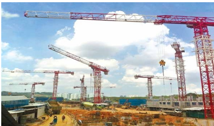
2013年5月，中联重科塔式起重机助建中冶新加坡组屋项目