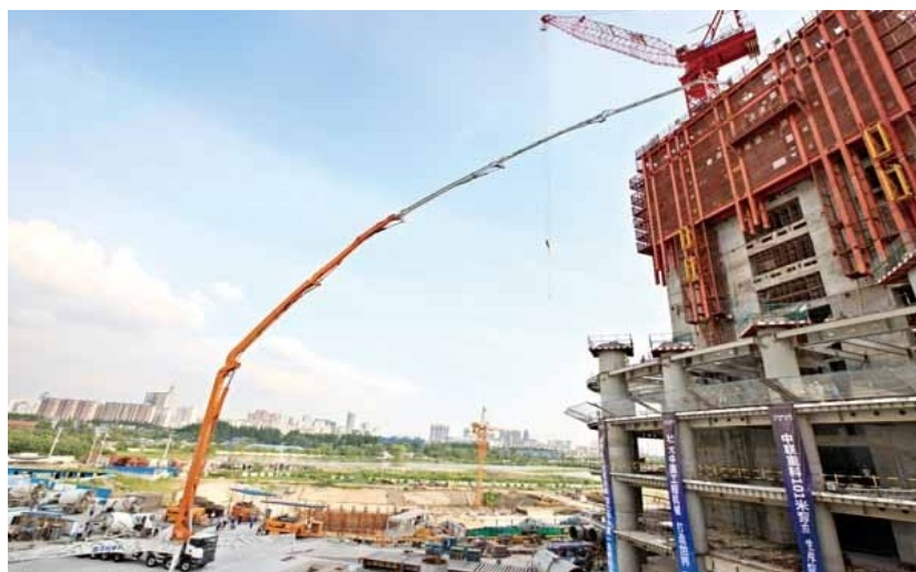
2013年7月，中联重科全球最长碳纤维臂架泵车在武汉中心施工