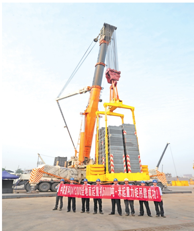
2013 年 10 月，中联重科全球最大 QAY2000 全地面起重机矩吊载试验成功