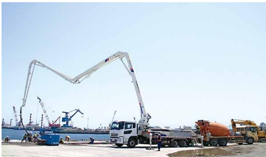
2013年4月，中联重科泵车参与日本福岛相马港施工